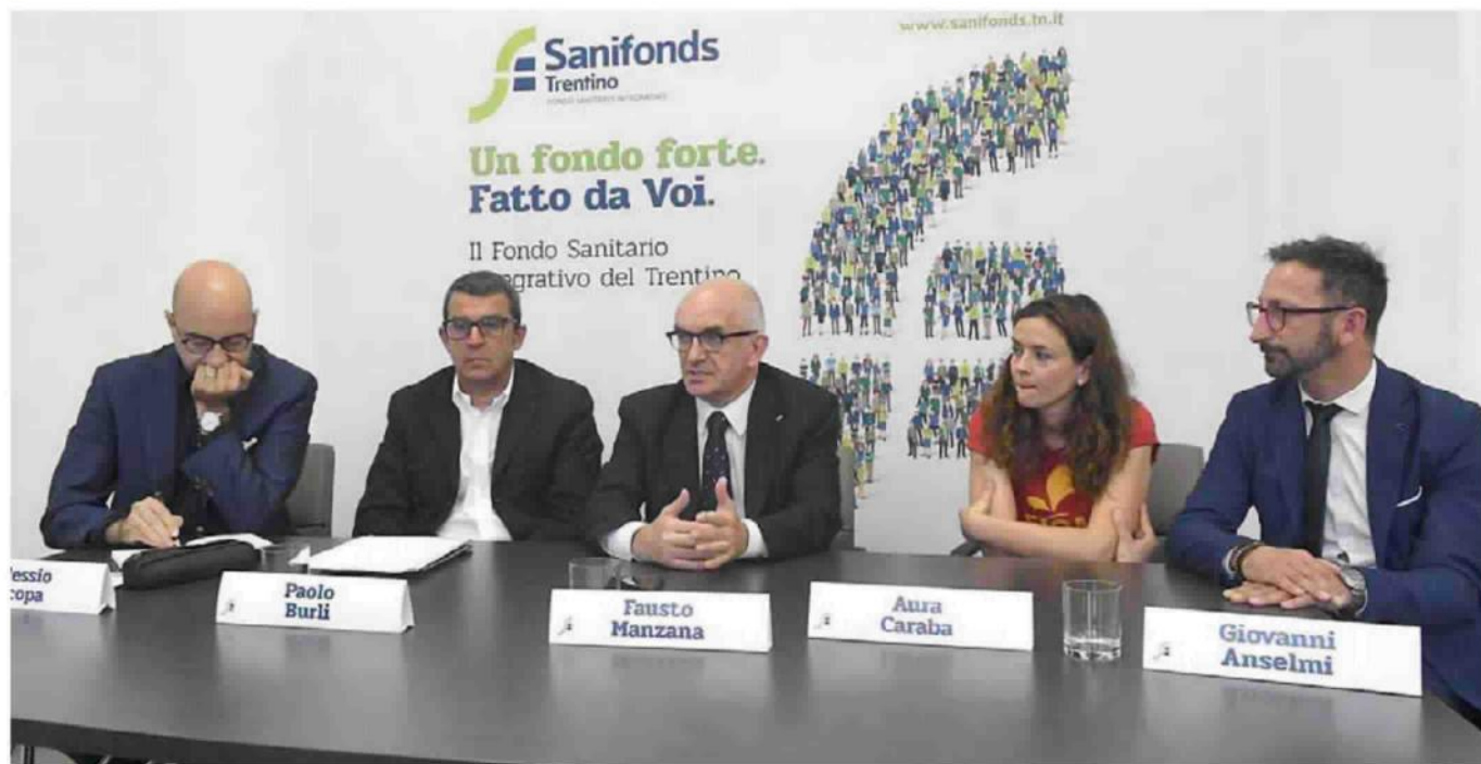
• Un momento della presentazione ieri dell'accordo fra Gpi group (al centro il presidente Manzana) e il fondo sanitario integrativo Sanifonds.