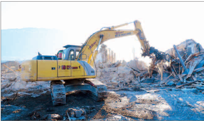
A sinistra una ruspa al lavoro per l'abbattimento delle vecchie caserme, ora rase al suolo (vedi sopra) per fare posto al nuovo ospedale. A destra l'area di progetto

Al vaglio dell'esame di congruità l'offerta dell'associazione di imprese tra Impregilo e il consorzio tra Pvb, Gpi, Ams, Miorelli Service, Famas e Marks che risulta la migliore per costruire e gestire il Nuovo ospedale del Trentino