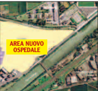
AREA NUOVO OSPEDALE